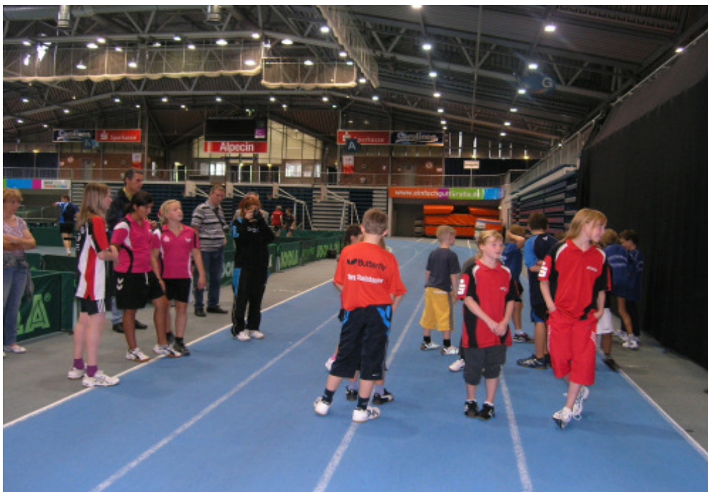
Siegerehrung der C-Schüler + C-Schülerinnen