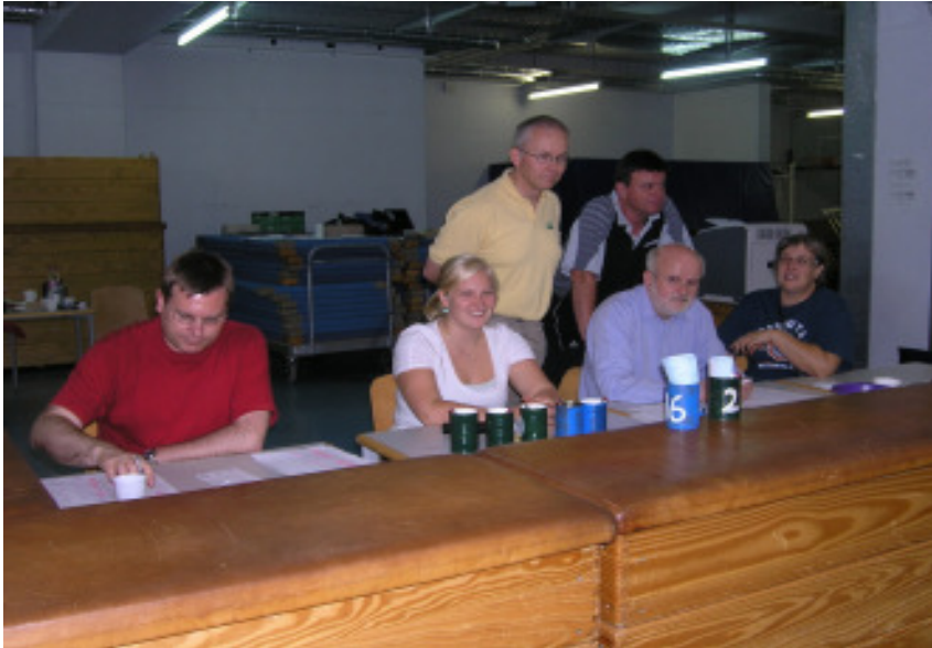
Turnierleitung - 11.09.2010